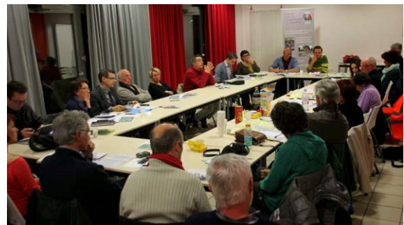
Huit listes candidates aux municipales ont répondu à notre questionnaire et participé à la soirée débat « Quelle politique cyclable pour l'agglomération ? » le 11 mars dernier.