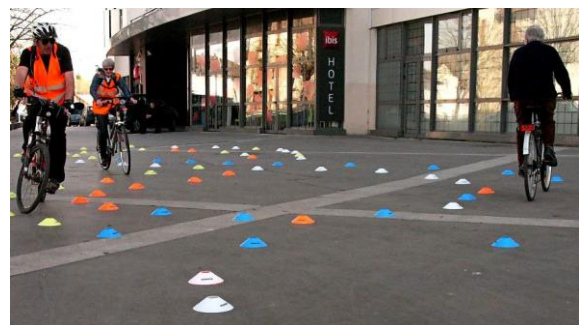
Pour la troisième année, EVAD anime des séances de remise en selle pour les adhérents de l'OPAD. Avant de se lancer dans la « vraie » circulation, chacun s'assure de la bonne maîtrise de son véhicule...

• RETROUVEZ AUSSI EVAD SUR FACEBOOK ET TWITTER !