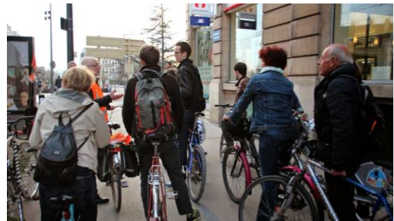
Guidés par EVAD deux candidates et un candidat aux dernières élections municipales ont effectué un tour à vélo dans la ville. La presse était là aussi...