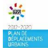
Schéma directeur des modes actifs du Grand Dijon : EVAD propose quelques premiers éléments de réflexion pour espérer atteindre cet objectif, ambitieux mais nécessaire ! »»»