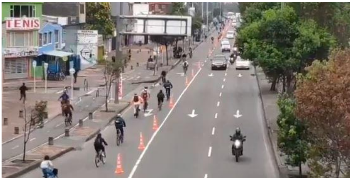
Bogota (Colombie) : La ville a créé une piste cyclable de 22 km en une nuit en fermant les voies réservées aux voitures.

https://www.cerema.fr/fr/actualites/amenagements-cyclables-temporaires-confinement-quelles